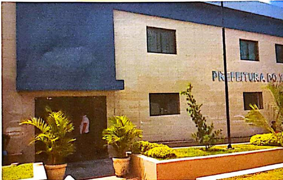
Prefeitura Municipal do Xexéu