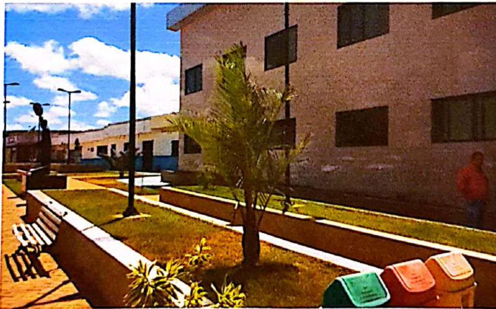
Prefeitura Municipal do Xexéu