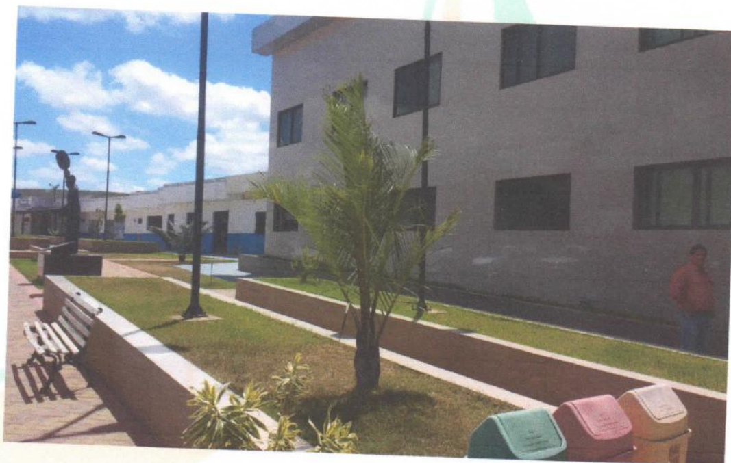
Prefeitura Municipal do Xexéu