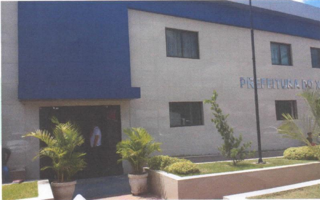
Prefeitura Municipal do Xexéu