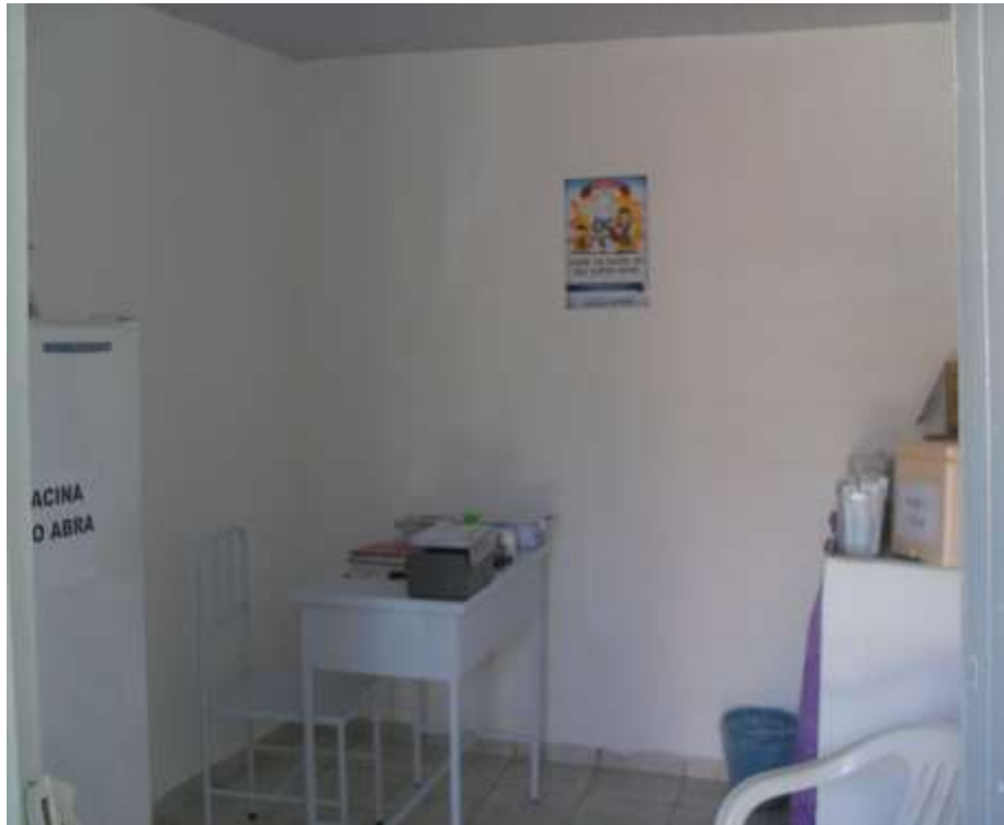
Sala da vacina