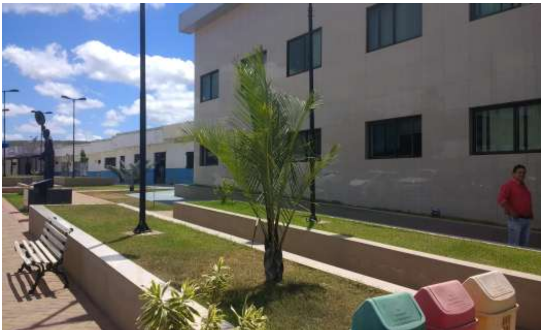
Prefeitura Municipal do Xexéu