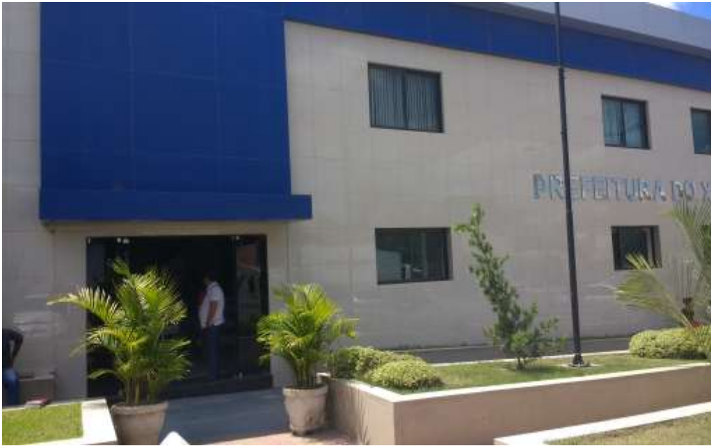
Prefeitura Municipal do Xexéu