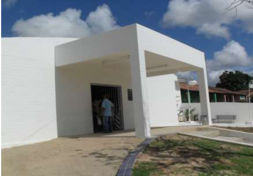
Unidade Mista Santa Joana