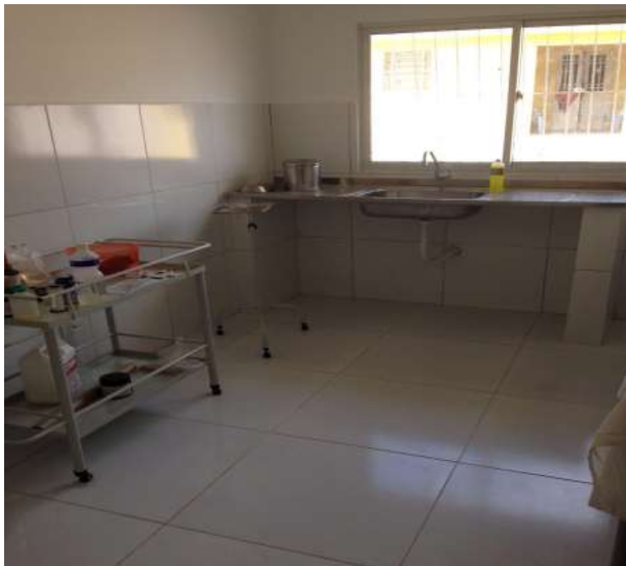
Sala de procedimentos