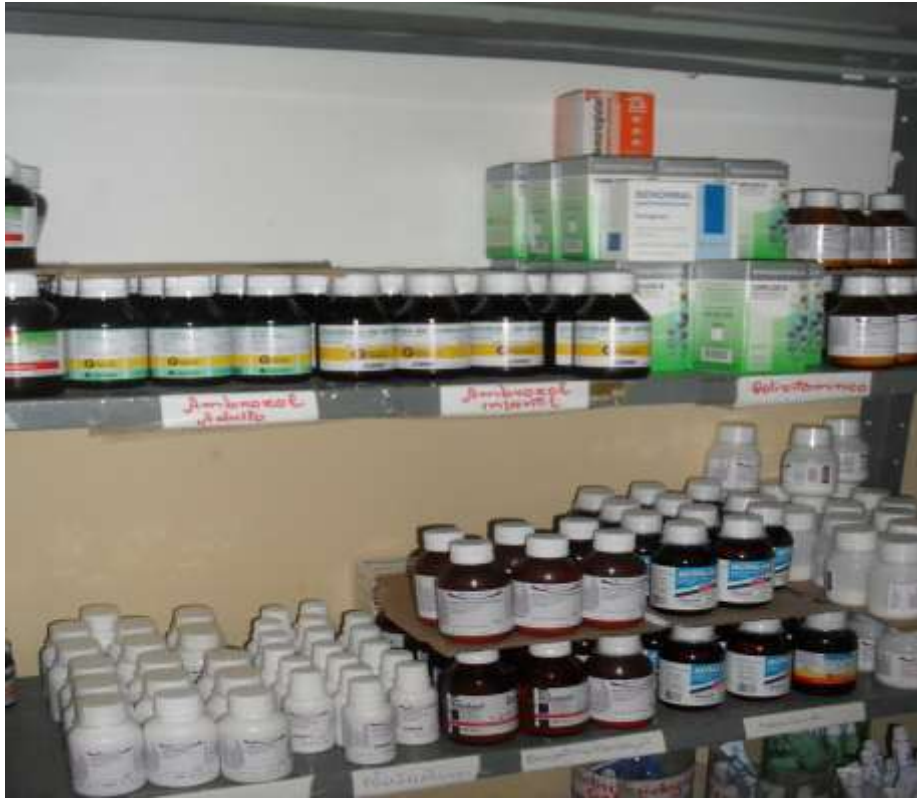
Farmácia do PSF II