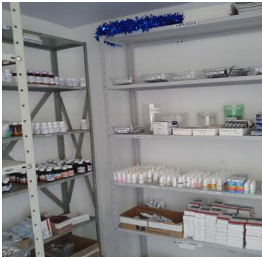
Farmácia do PSF III