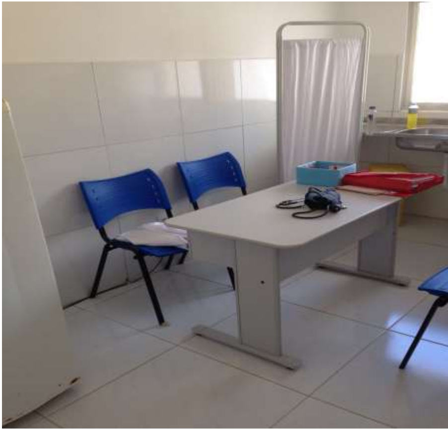
Sala de vacina