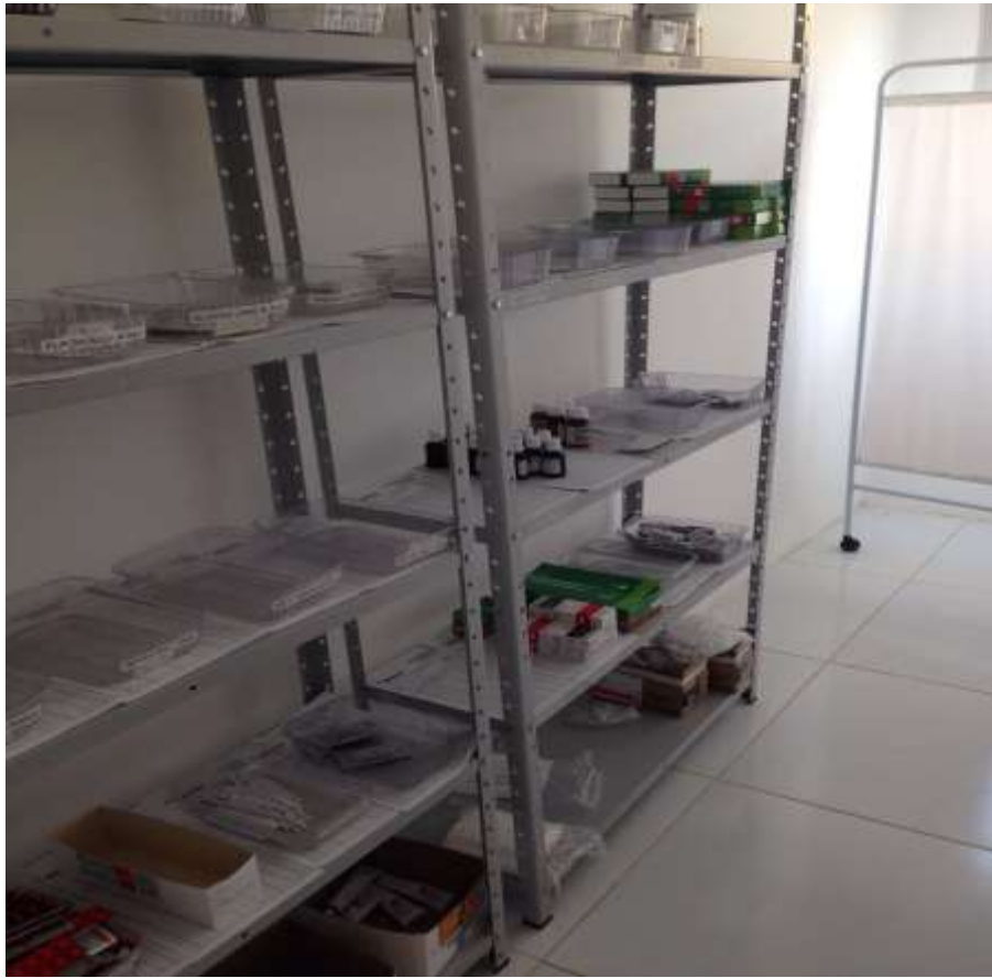
Farmácia do PSF I