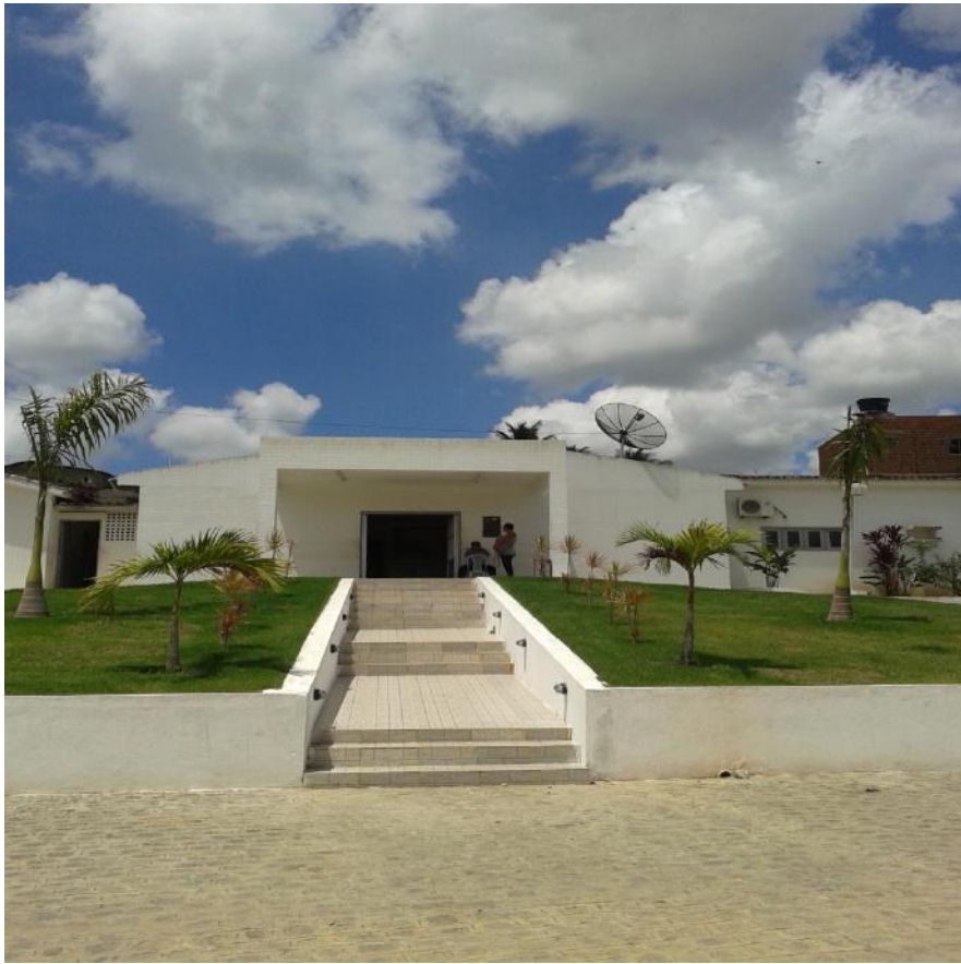
Unidade Mista Santa Joana