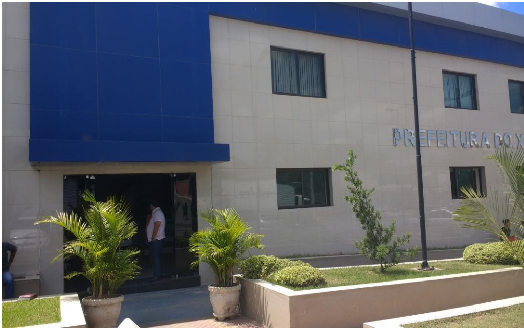
Prefeitura Municipal do Xexéu