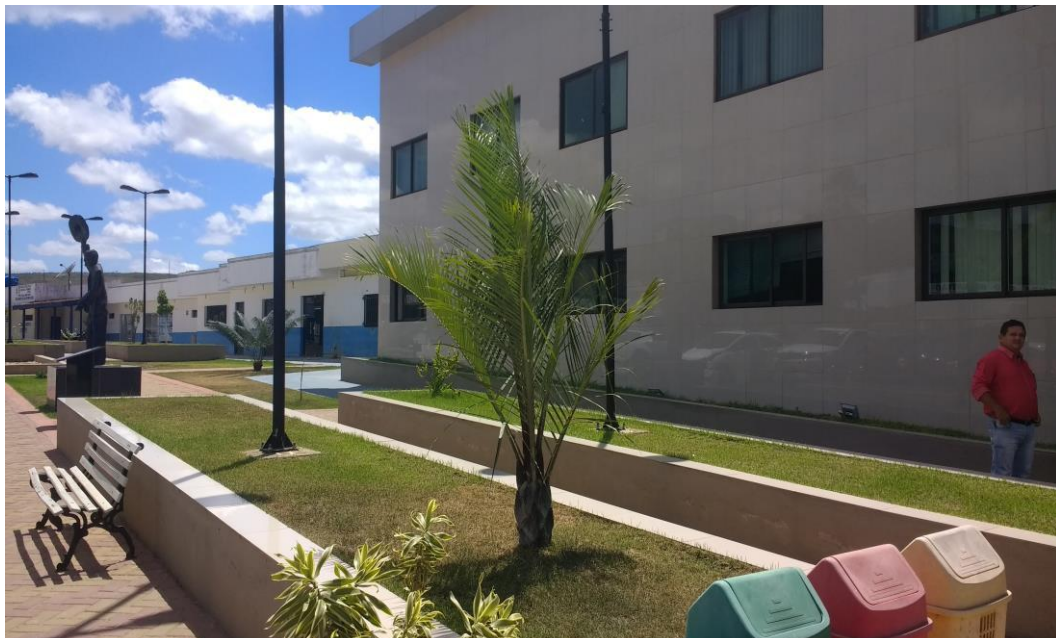
Prefeitura Municipal do Xexéu