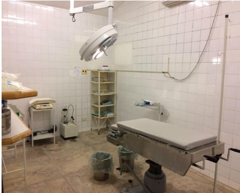
Sala de parto.