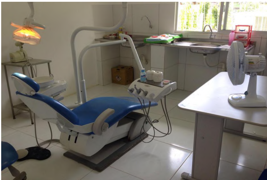
Sala de dentista