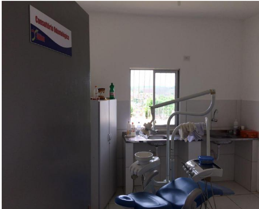
Consultório odontológico do PSF II